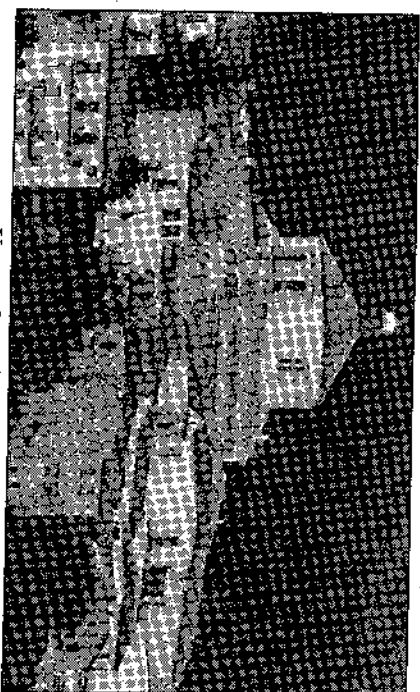
Una veduta di Sessano